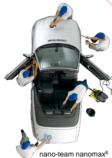
nano-team nanomax ®

NANO-komponenty użyte w preparacie są bezpieczne dla człowieka i środowiska. Produkty nanomax ® łączy ultra nowoczesna technologia oparta o własny know-how, gwarantująca najwyższą skuteczność i wydajność. Są one dostępne w bezpiecznych opakowaniach 500ml oraz 1000ml . Dla profesjonalistów i przemysłu dostarczamy je także w kanistrach 5L oraz beczkach i „mauserach” (paleta-pojemnikach 1000L ). UWAGA: produkt agresywny, który należy używać w rękawicach ochronnych. Przed użyciem dokładnie przeczytaj opis na etykiecie !